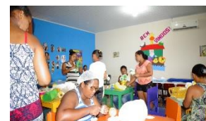
Workshop knutselen en borduren