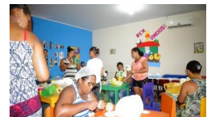
Workshop knutselen en borduren